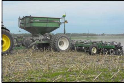
Utilisation pour l'application d'engrais avec strip-till