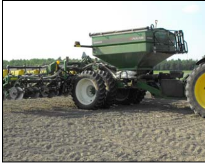
Utilisation lors du semis avec planteur à maïs