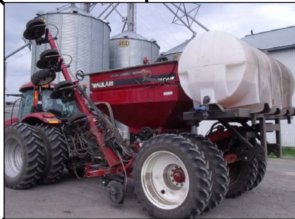
Utilisation lors du semis avec semoir à céréales