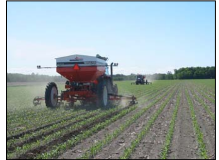
Utilisation pour l'application d'engrais en postlevée